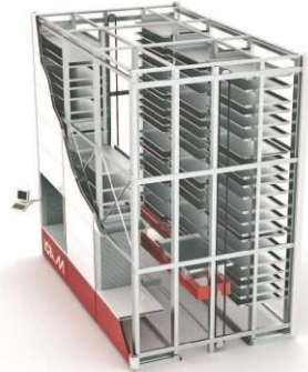
Vertikale automatische Lager