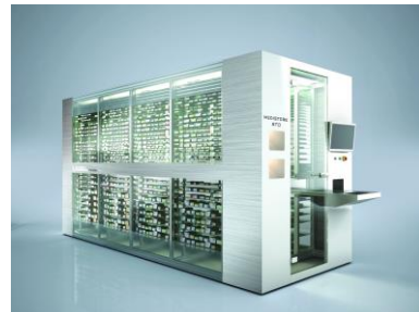
Automatische Systeme für Apotheken