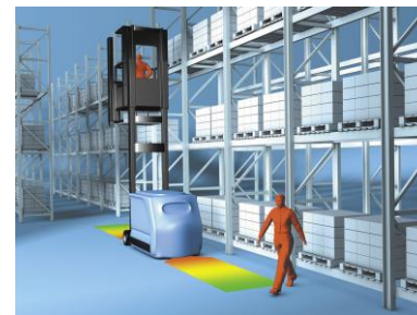
Sistemi di sicurezza per il Material Handling