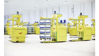
Sistemi AGV Germania