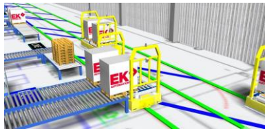
Sistemi AGV Italia